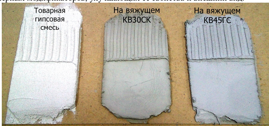
Рис. 3. Внешний вид штукатурных составов Fig. 3. Appearance of plaster compositions

На основе разработанных вяжущих были получены и испытаны образцы штукатурных составов с добавлением песка (рисунок 3). Оценивая внешний вид полученных экспериментальных образцов штукатурки на основе композиционных вяжущих (наличие усадки, небольших трещин), стоит принять во внимание, тот факт, что в наши смеси добавлялся только пластификатор, а гипсовая штукатурка в своем составе содержит множество полимерных модификаторов, улучшающих ее свойства и внешний вид.